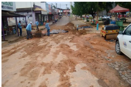
Foto 01: escavação na Rua Heleno de Andrade para a instalação do Hidrante.