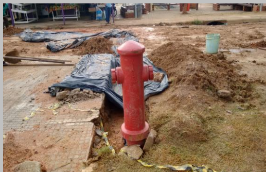
Foto 03: Hidrante de Coluna Urbano Simples Corpo de tampa em ferro fundido, NBR 6916.